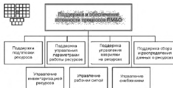
Рисунок 3 — Декомпозиция процесса 1.1.3.1 — «Поддержка и обеспечение готовности процессов RM&O» на элементы процессов уровня 3

6.2 Процесс 1.1.3.1 и его элементы процессов уровня 3 предназначены для обеспечения возможностей выполнения и готовности процессов FAB: подготовки ресурсов, управления авариями на ресурсах, управления параметрами работы ресурсов, сбора и распределения данных о ресурсах, а также для выполнения процессов управления инвентаризацией ресурсов, рабочей силой и материально-техническим снабжением.