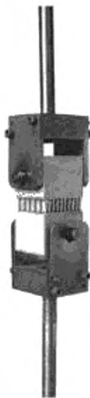
Рисунок 1 — Приспособление для нагружения для определения предела прочности на растяжение перпендикулярно к плоскости «сэндвич»-конструкций

Приспособление для нагружения должно быть самоцентрирующимся и не должно вызывать эксцентрических нагрузок. Подходящий тип приспособления для нагружения показан на рисунке 1.