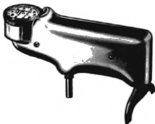
Рисунок 1 — Твердомер Баркола