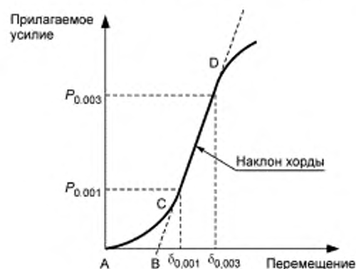
Рисунок А1.1 — График с линейным участком

А1.3 При измерениях модуля упругости материала внутреннего слоя «сэндвич»-конструкций желательно, чтобы нелинейный участок в нижней части кривой был в диапазоне менее \delta_{0,001} .