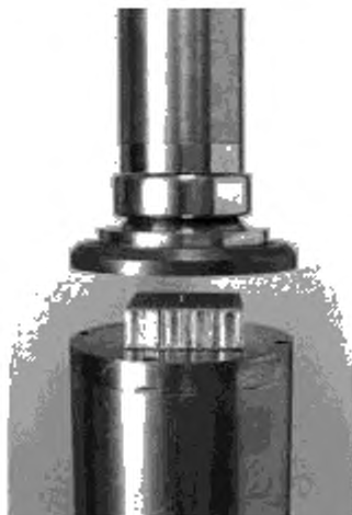
Рисунок 2 — Машина для испытания для определения механических характеристик при сжатии и устройство индикации смещения

П р и м е ч а н и е — Тензометры, жестко связанные с поверхностью исследуемого объекта, обычно считают непригодными для измерения деформации в данном случае из-за их жесткости. Армирующий эффект жесткой связи датчиков с некоторыми видами внутреннего слоя может привести к большим погрешностям в измерениях деформации.