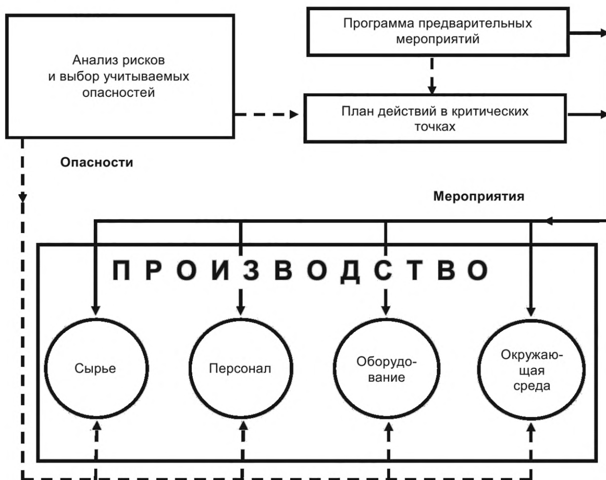
Рисунок 1 — Анализ опасностей и их устранение в процессе производства

2 уровень — это действия в критических контрольных точках, которые с учетом мероприятий 1-го уровня должны обеспечить устранение или снижение до допустимого уровня всех учитываемых опасных факторов. Данный подход иллюстрируется схемой, представленной на рисунке 1.