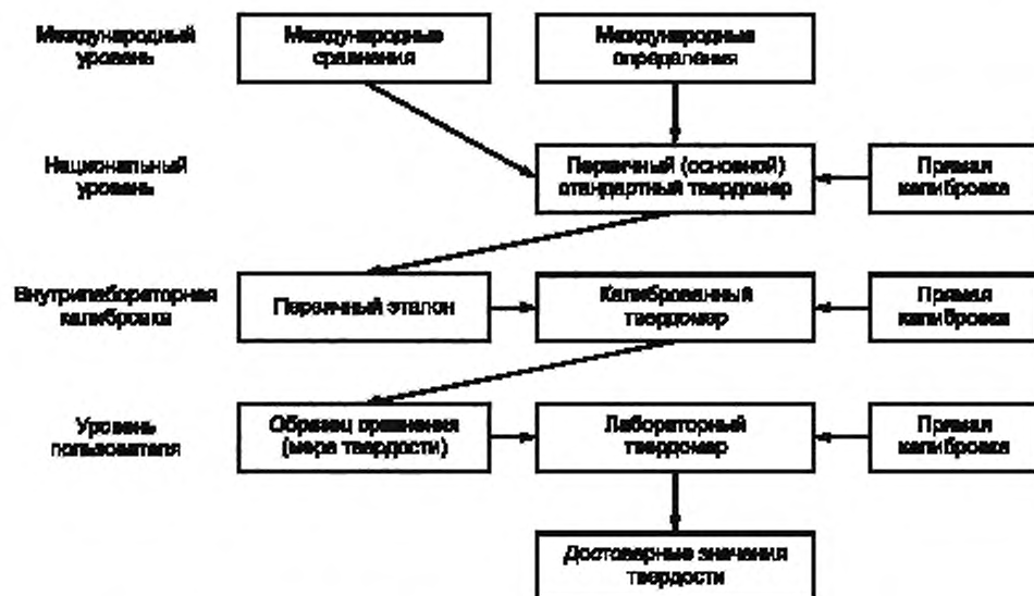
Рисунок В.1 — Структура метрологической цепочки прослеживаемости для определения и распространения шкалы твердости

На рисунке В.1 показана четырехуровневая структура метрологической цепочки прослеживаемости для определения и распространения шкалы твердости. Цепочка начинается с международного уровня, при этом используются международные определения различных шкал твердости для проведения международных сравнений. Число первичных стандартных твердомеров на национальном уровне определяют первичные меры твердости для калибровки твердомеров на лабораторном уровне. Естественно, что прямую калибровку и верификацию этих машин следует проводить с максимальной точностью.