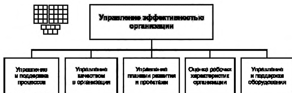
Рисунок 3 — Декомпозиция группы процессов «Управление эффективностью организации» на элементы процессов уровня 2

6.2 Процессы группы 1.3.3 предназначены для управления деятельностью организации с целью обеспечения рационального и эффективного выполнения производственных процессов.