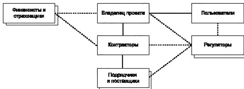
Рисунок 1 — Заинтересованные стороны проекта