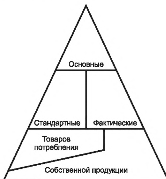
Рисунок D.1 — Типы классов

Отношения между различными типами классов иллюстрируются треугольником на рисунке D.1.