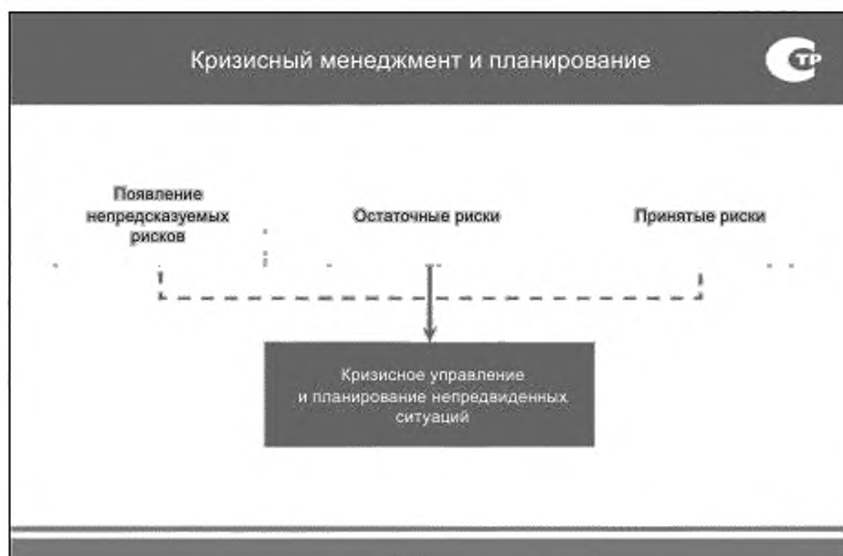
Рисунок 1 — Кризисный менеджмент и планирование

Цель кризисного управления состоит в том, чтобы подготовиться к кризисам так, чтобы наносимый ими ущерб был минимален. Много кризисных событий происходит одинаково и приводит к аналогичным последствиям независимо от того, вызваны ли они различными рисками. В случае если риск, который вызывает кризисные проявления, является вновь возникающим (как это часто бывает), а потому не зафиксированным на стадии идентификации, для такого риска может использоваться план действий для непредвиденных ситуаций.