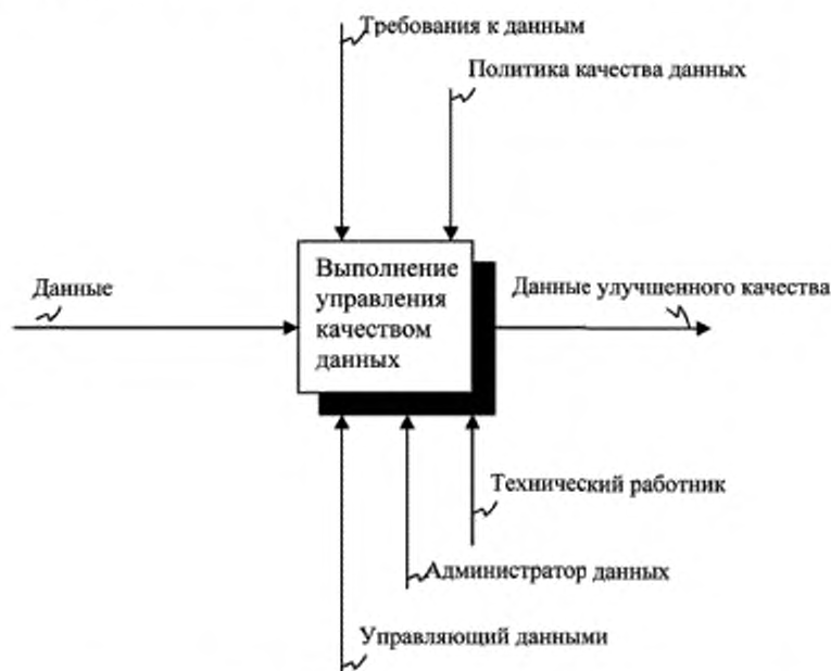
Рисунок С.1 — Функциональная модель структуры на верхнем уровне

Диаграмма структуры представлена на рисунках С.1—С.5 в порядке следования узлов.