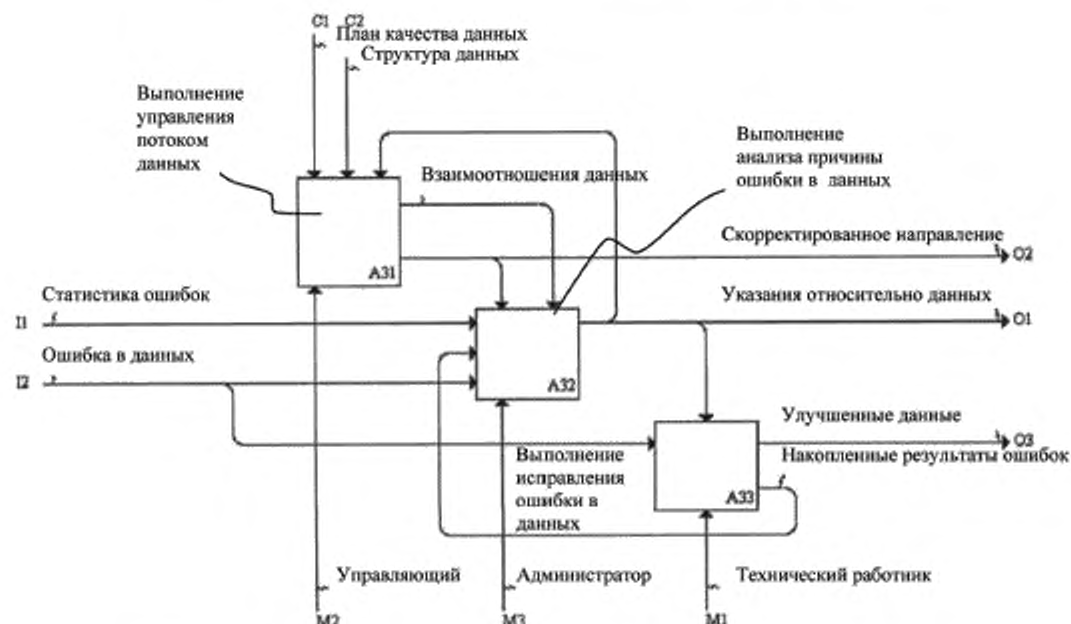
Рисунок С.5 — Процессы верхнего уровня управления качеством данных на третьем уровне