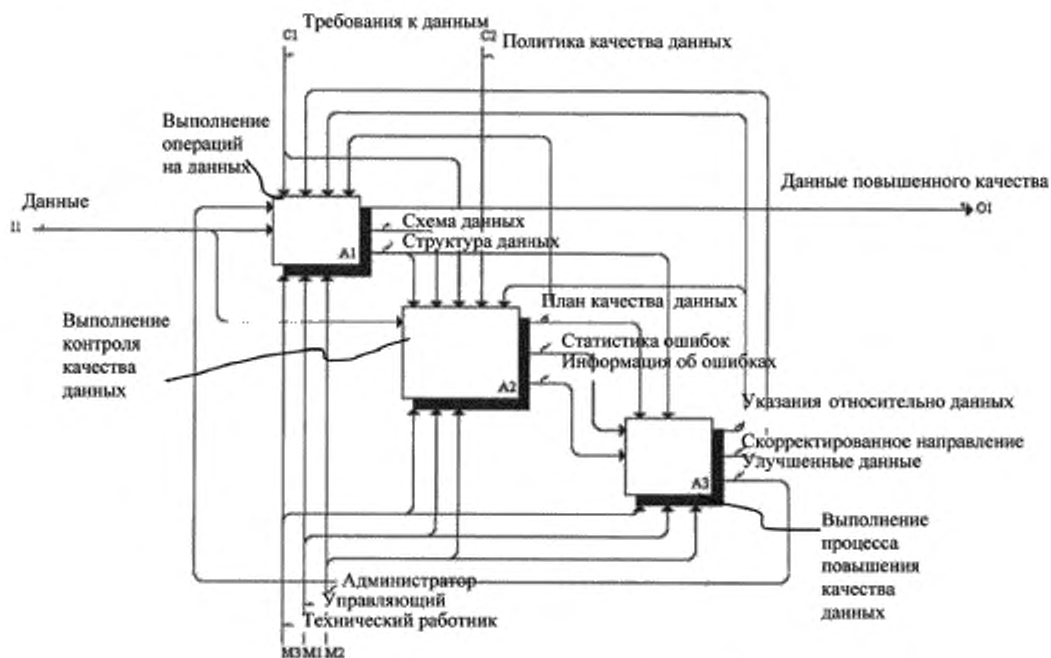
Рисунок С.2 — Процессы верхнего уровня на втором уровне