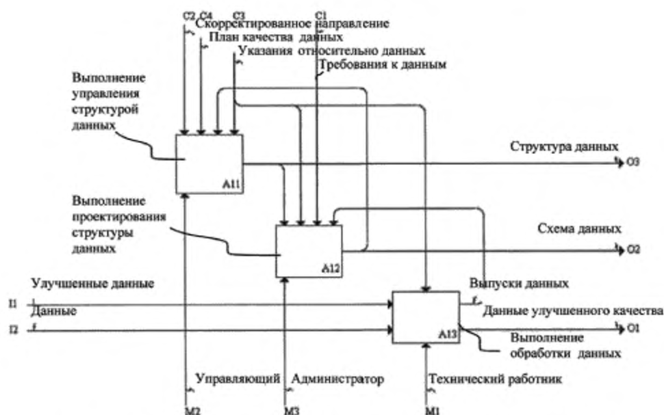
Рисунок С.3 — Процессы верхнего уровня операций над данными на третьем уровне