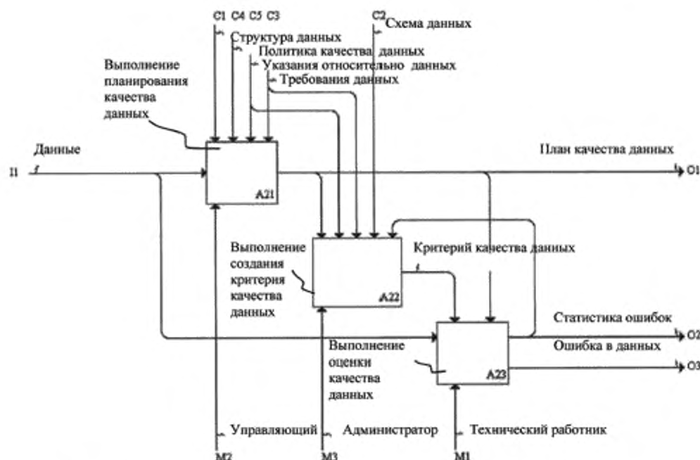
Рисунок С.4 — Процессы верхнего уровня контроля качества данных на третьем уровне