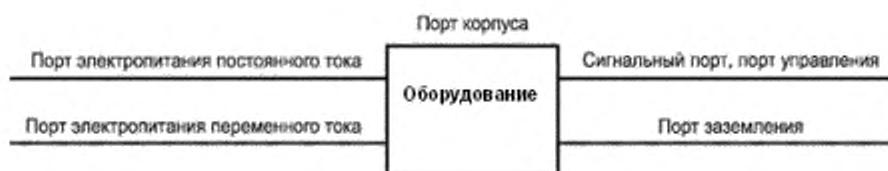
Рисунок 1 – Примеры портов