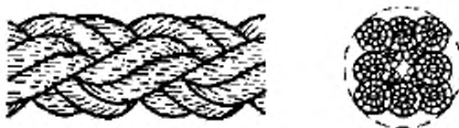
Рисунок 3-Конфигурация 8-рядного плетеного каната (тип L)