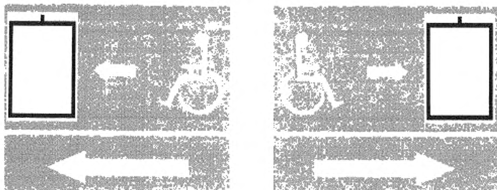
Рисунок В.1 — Указатель направления движения к эвакуационному лифту

Размер пиктограммы должен быть не менее 200 × 150 мм и иметь соответствующую подсветку.