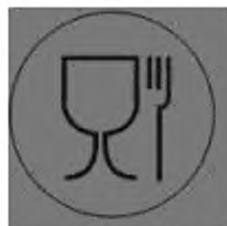
Рисунок А.1 – Для пищевых продуктов

А.2 Символы и пиктограммы, наносимые на изделие или упаковочный лист (вкладыш), или товаросопроводительную документацию, – см. рисунки А.1, А.2.