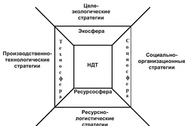
Рисунок 1 — Модель «Стратегии и наилучшие доступные технологии (НДТ)»

Структура настоящего стандарта отличается от структуры исходных аналогов [1]: вначале оценивается ресурсный состав (потенциал) свинцовых аккумуляторов (раздел 4); затем рассматриваются положения по обращению с отходами (разделы 5, 6) на этапах их технологического цикла (ГОСТ Р 53692); после этого установлены (разделы 7, 8) положения, повышающие экологическую безопасность технологий; в разделе 9 оценивается социально-экономическая значимость работ, т. е. ожидаемые от них эффекты. Структура, представленная на рисунке 1, и одновременный учет элементов стратегий почти во всех разделах настоящего стандарта позволяют охватить все четыре блока стратегий, обеспечивающих в качестве «рамочных» стратегических ограничений (ГОСТ Р 51750) при одновременном их учете устойчивость любой хозяйственной деятельности.