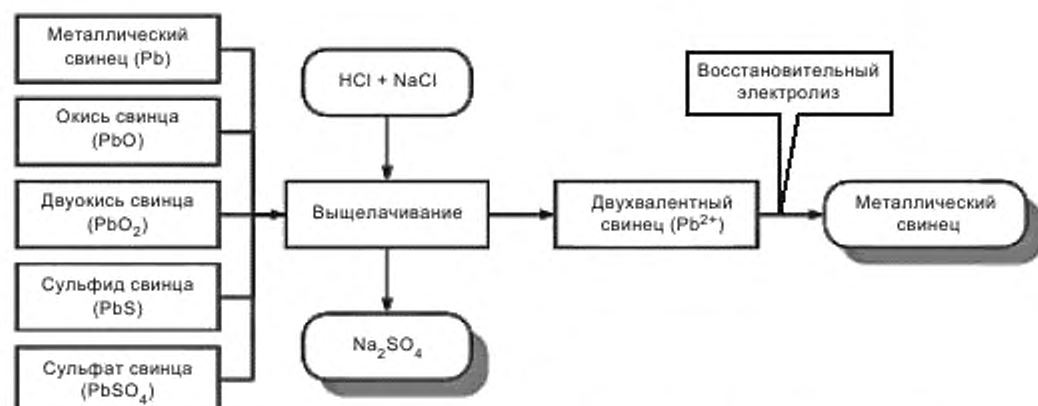
Рисунок 4 — Электрохимические процессы при гидрометаллургическом производстве свинца

На рисунке 4 представлены электрохимические процессы при гидрометаллургическом производстве свинца.