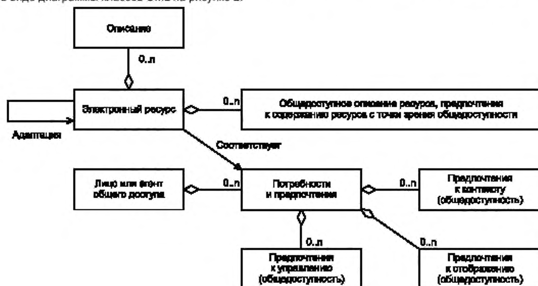
Рисунок 2 — Абстрактная модель общедоступности

Абстрактная модель для последующих частей настоящего стандарта (типов А и Б) представлена в виде диаграммы классов UML на рисунке 2.