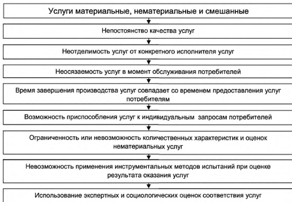
Рисунок 2 — Специфические особенности услуг

Поэтому при разработке и внедрении системы менеджмента качества в организациях, предоставляющих услуги населению, необходимо учитывать особенности сферы услуг.