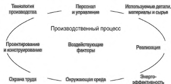
Рисунок 2 — Основные объекты, требования к которым устанавливаются в технических регламентах и стандартах в области машинного оборудования

На рисунке 2 представлены основные объекты, требования к безопасности которых устанавливаются в технических регламентах и стандартах на машинное оборудование, а на рисунке 3 приведена детализированная структура шаблона для требований к машинному оборудованию.