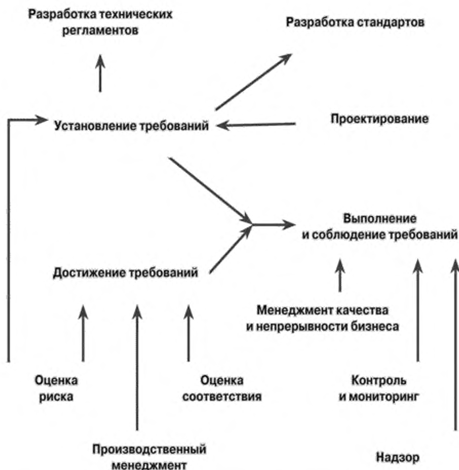
Рисунок 2 — Структура области компетентности экспертов в сфере технического регулирования

На рисунке 2 представлена структура области компетентности экспертов в сфере технического регулирования, а ниже приведен шаблон для этой структуры.