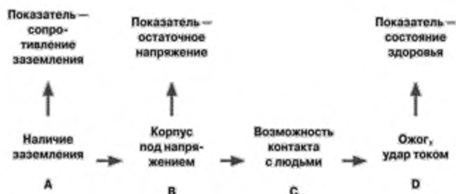
Рис. 2. Пример опасного события «корпус под напряжением»

На рисунке 2 приведен пример схемы связи для опасного события «корпус под напряжением».