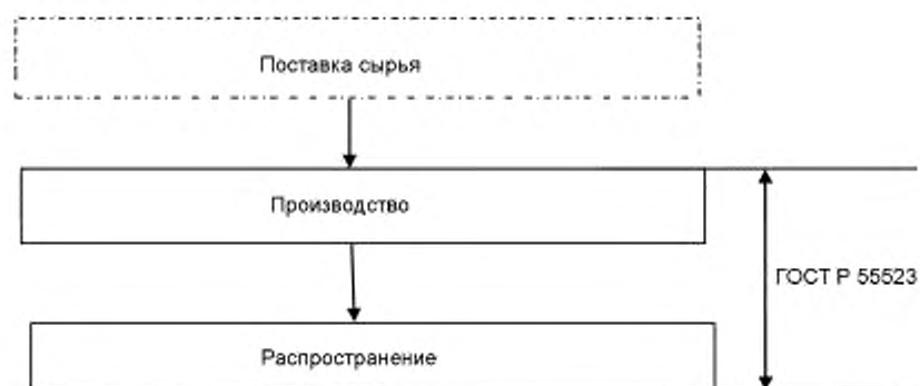
Схема 1 — Упрощенный пример цепочки поставки древесных брикетов

Цепочка поставки имеет три части, как показано на схеме 1.