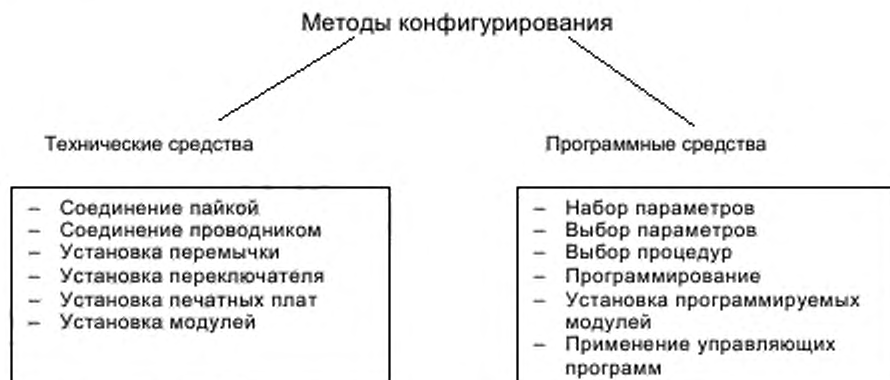
Рисунок 3 — Методы конфигурирования

Средства конфигурирования могут быть применимы на любом уровне системы. Методы поддержки этих средств показаны на рисунке 3