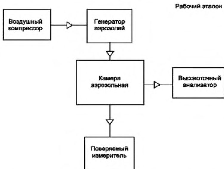
Рисунок В.2 — Структурная схема поверки ПИП массовой концентрации пыли

Рисунок В.1 — Схема подачи ГС из баллонов под давлением на ПИП объемной доли метана, кислорода, оксида углерода и диоксида углерода