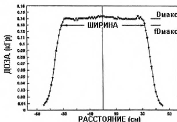
Рисунок 2 – Пример измеренного распределения дозы облучения электронным пучком по ширине пучка, где ширина пучка определена по некоторой заданной доле f от средней максимальной дозы D_{\max}

электромагнитного сканирования узким пучком (в этом случае ширину луча также называют шириной сканирования), дефокусирующие элементы, рассеивающие фольги.