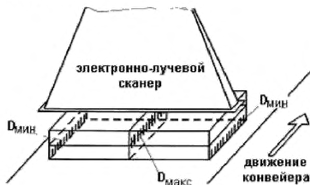
Рисунок 4 — Области D_{\max} и D_{\min} (показанные штриховкой) для случая прямоугольной технологической загрузки при одностороннем облучении электронным пучком

11.5.1.2 Условия облучения — В зависимости от насыпной плотности, толщины, неоднородности технологической загрузки, некоторые технологии могут требовать применения двустороннего облучения для достижения приемлемого значения коэффициента неравномерности дозы [3], см. также руководство ISO/ASTM 51649. В случае двустороннего облучения области максимальной и минимальной доз могут быть совершенно другими по сравнению с односторонним облучением (см. рисунки. 4 и 5 для облучения электронным пучком). В связи с этим при электронном облучении необходимо соблюдать осторожность при двустороннем (или многостороннем) облучении, поскольку небольшое изменение толщины или насыпной плотности технологической загрузки или энергии электронов может привести к созданию неприемлемой дозы вблизи центра технологической загрузки. В случае облучателей сплошного потока равномерность поглощенной дозы может быть улучшена путем размещения отражателей для регулирования потока продукта через зону облучения.