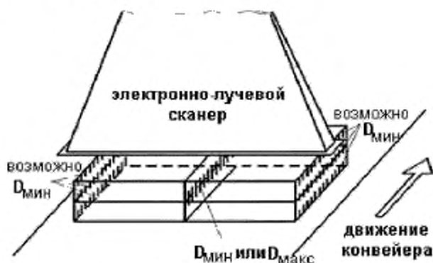
Рисунок 5 — Области D_{\max} и D_{\min} (показанные штриховкой) для случая прямоугольной технологической загрузки при двустороннем облучении электронным пучком

11.5.1.3 Характеристики технологической загрузки — В некоторых случаях может потребоваться разработка другой схемы технологической загрузки, позволяющей получить приемлемое значение коэффициента неравномерности дозы.