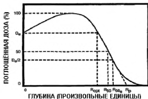
Рисунок 3 – Типичное (идеализированное) распределение дозы по глубине для электронного пучка в однородном материале, состоящем из элементов с низким атомным номером

3.1.9 распределение дозы по глубине (depth-dose distribution): Изменение поглощенной дозы с глубиной, отсчитываемой от наружной поверхности материала, подвергаемого облучению данным видом радиации (типичное распределение см. на рисунке 3).