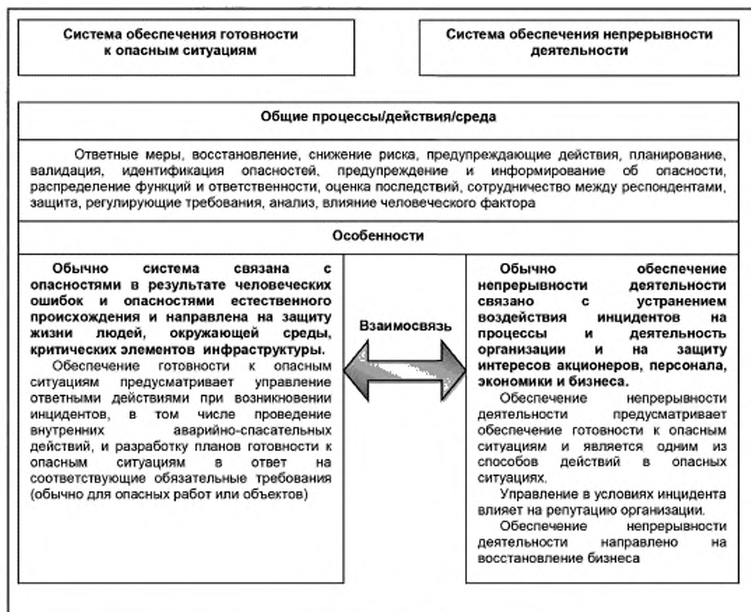
Рисунок 2 — Взаимосвязь элементов системы обеспечения готовности к опасным ситуациям и инцидентам и обеспечения непрерывности деятельности

Взаимосвязь элементов систем обеспечения готовности к опасным ситуациям и инцидентам и обеспечения непрерывности деятельности приведена на рисунке 2. Данная схема предназначена только для информации.