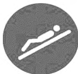
Рисунок И.1 — Положение на спине головой назад