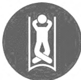
Рисунок И.14 — Положение на спине головой назад, ноги скрещены, руки за головой