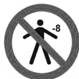
Рисунок К.4 — Детям младше 8 лет спуск запрещен