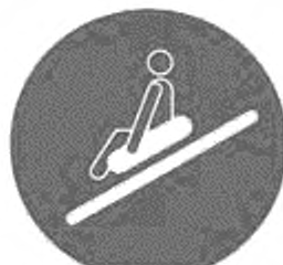
Рисунок И.7 — Пользоваться одноместным рафтом