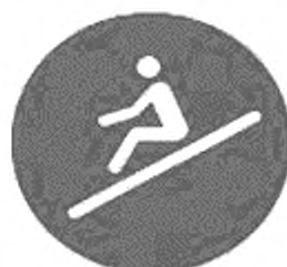
Рисунок И.3 — Положение сидя лицом вперед