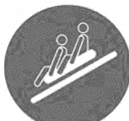
Рисунок И.8 — Пользоваться многоместным рафтом