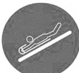
Рисунок И.9 — Пользоваться ковриком