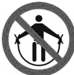
Рисунок К.5 — Запрещено держаться за борты трассы спуска