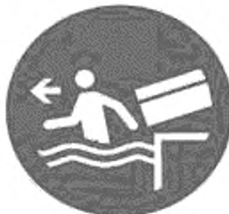
Рисунок И.5 — Немедленно покинуть зону финиша