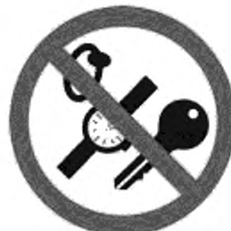
Рисунок К.6 — Запрещен спуск с посторонними предметами