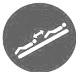
Рисунок И.10 — Соблюдай дистанцию