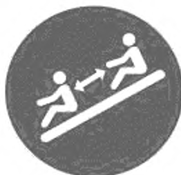
Рисунок И.11 — Соблюдай дистанцию