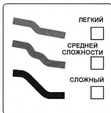
Рисунок Л.1 — Степень сложности спуска