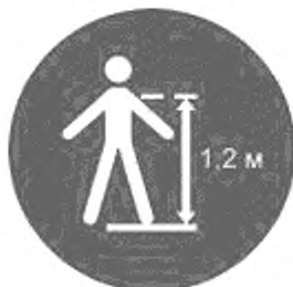
Рисунок И.13 — Минимальный рост для конкретной горки