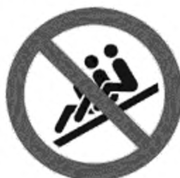
Рисунок К.2 — Спуск цепочкой запрещен