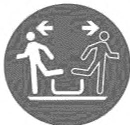
Рисунок И.6 — Немедленно покинуть специальное приемное устройство