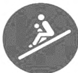
Рисунок И.4 — Положение сидя, ребенок перед взрослым, лицом вперед