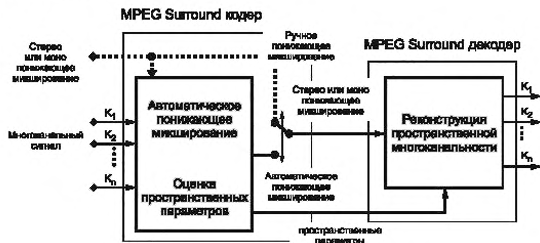
Рисунок 1 — Принцип MPEG Surround с понижающим микшированием с применением кодирования MPEG-1 Layer II

Допускается кодирование аудио выполнять в двухканальном режиме в соответствии с Рекомендацией ISO/IEC [4], в котором два аудио канала с независимым содержанием программ (например, двуязычных) кодируются в одном потоке битов. Детализированные условия применения такого режима должны быть в соответствии с ETSI [16] (пункт 6.1.1).