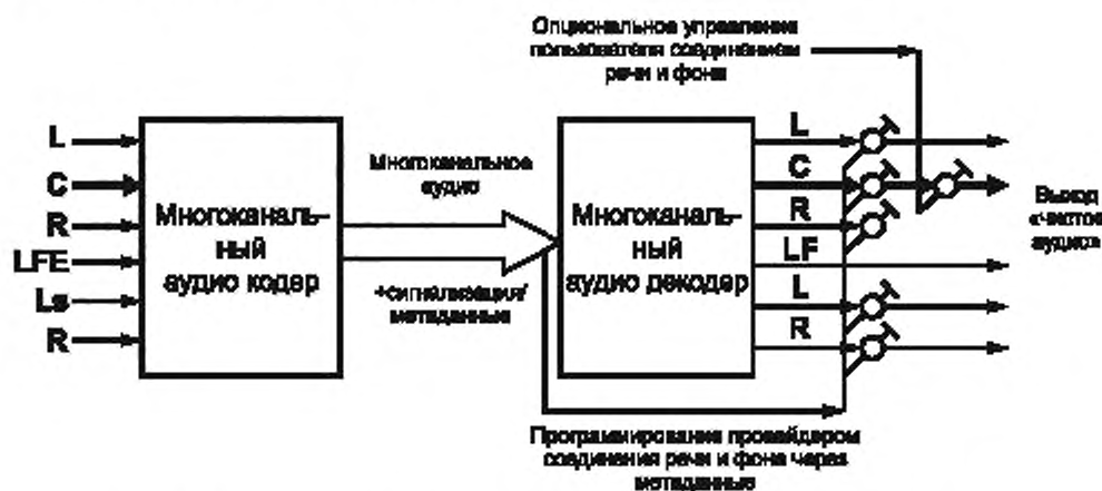
Рисунок Г.2 — Принципы обработки сигналов в декодере SA для случая «чистого аудио»

Принципы обработки сигналов в приемнике-декодере SA для случая Clean Audio, когда основное аудио передается в формате стерео, показаны схематически на рисунке Г.2.