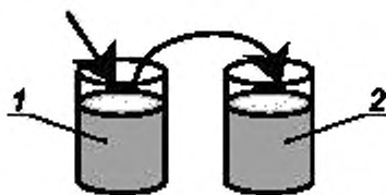
1 — стакан с пробой моторного топлива (промывка); 2 — стакан с пробой моторного топлива (измерение)

5.2.1 Измерительный датчик анализатора устанавливают поочередно в стаканы (рисунок 1), предварительно наполнив их измеряемой пробой.