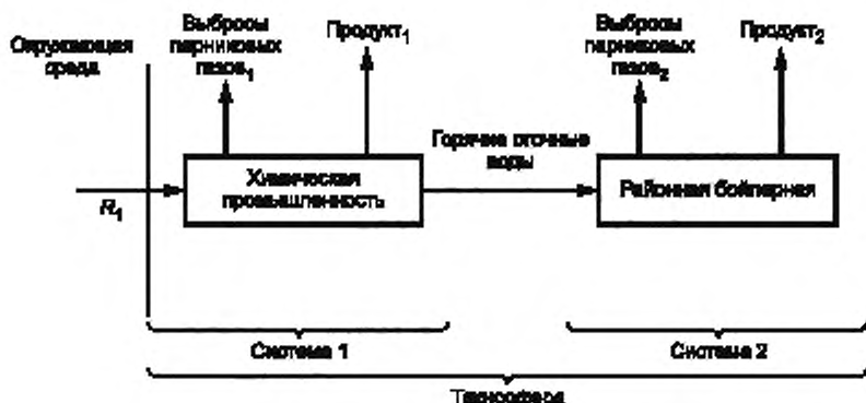
Рисунок 1 — Незамкнутый цикл