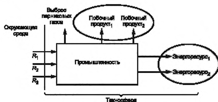
Рисунок 3 — Многовыходная система

Распределение между энергоресурсами 1 и 2, за вычетом доли побочных продуктов: оставшаяся часть должна быть распределена между энергоресурсами пропорционально энергопотокам.