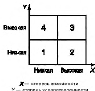
Рисунок D.1 — Классификация характеристик

Характеристики в зонах 3 и 4 оказывают наибольшее потенциальное влияние на удовлетворенность в целом. Такая информация может помочь организации в определении приоритетности мер, ведущих к повышению удовлетворенности потребителей.