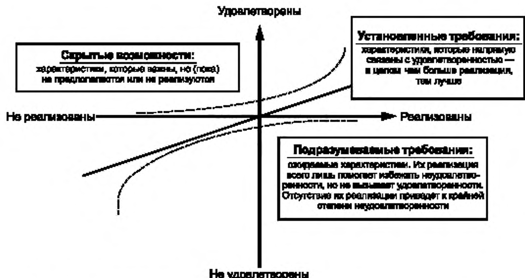
Рисунок В.1 — Взаимосвязь между реальными характеристиками и удовлетворенностью потребителей

Характеристики инфраструктуры — это характеристики продукции, которые не влияют на удовлетворенность потребителей, но необходимы для функционирования предприятия или эксплуатации продукции.