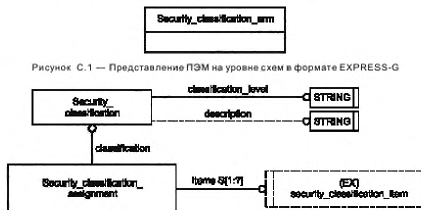
Рисунок С.2 — Представление ПЭМ на уровне объектов в формате EXPRESS-G

Графическая нотация EXPRESS-G определена в ИСО 10303-11, приложение D.