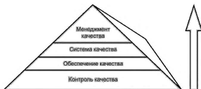
Рисунок 1 — Пирамида качества

Руководству лаборатории следует признать, что существует иерархия понятий, используемых для описания системы менеджмента качества услуг в области здравоохранения. Эти понятия, выстроенные с точки зрения управления, начинаются с общей философии менеджмента качества, в которой выражено стремление достичь качественных (безопасных, эффективных, своевременных и ориентированных на пациента) услуг в системе здравоохранения. Эта философия обычно охватывает менеджмент качества, который направлен на поддержание скоординированных и всеобъемлющих усилий соответствовать целям системы здравоохранения в области качества. Эти усилия известны как «система качества», которая включает в себя все виды деятельности в области обеспечения качества (часть менеджмента качества, сфокусированная на достижении уверенности в том, что требования к качеству будут выполнены) [1], а также все виды деятельности по контролю качества (часть менеджмента качества, сфокусированная на выполнении требований к качеству) [1] (см. рисунок 1).