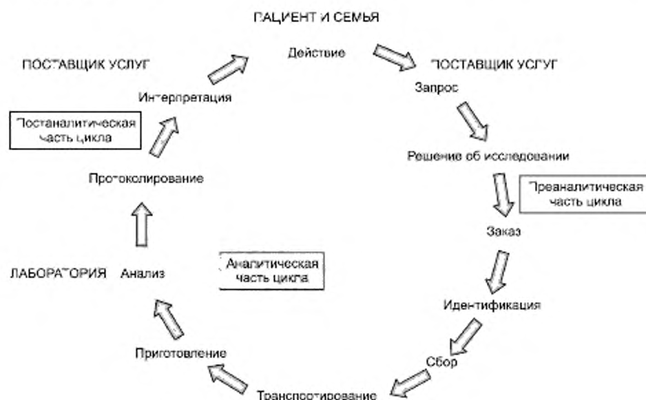
Рисунок 2 — Медицинская лаборатория. Полный цикл исследования

Необходимо постоянно проверять этот цикл для выявления возможности улучшения лабораторных услуг, например, путем сокращения числа образцов, не пригодных для исследований, которые получает лаборатория.