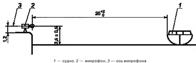
Рисунок 2 — Положение микрофона

9.1.3 Расстояние от микрофона до обращенного к нему борта судна должно быть 25^{+2}_0 м. Контроль расстояния производят при каждом проходе судна.