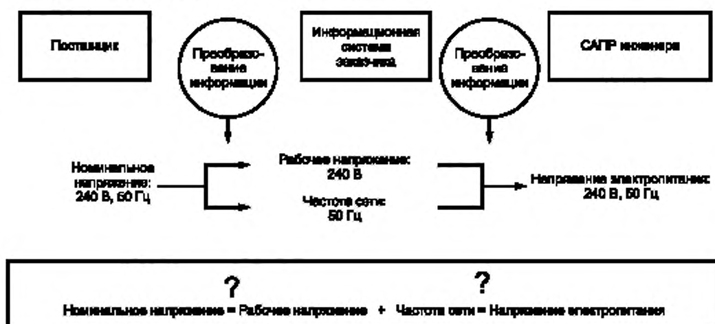
Рисунок 2 — Возможность или невозможность реального обмена информацией

Традиционно информация о продукции всегда была доступна в виде справочных технических листов и каталогов на бумажных носителях. С быстрым ростом информационных средств сбора, передачи и обработки этой информации к изготовителям стали предъявлять повышенные требования относительно ее предоставления в машинно-ориентированной форме, позволяющей избежать задержек и ошибок, присущих информации, переводимой с бумажных носителей на электронные. Кроме того, подобный перенос следует проводить с учетом стандартизованных методик, которые, при их применении, обеспечивали бы обмен информацией, ее функциональную совместимость как в пределах одного предприятия, так и между контрагентами вне его. Рисунок 2 иллюстрирует некоторые проблемы, которые могут возникать в информационной цепочке поставщика.