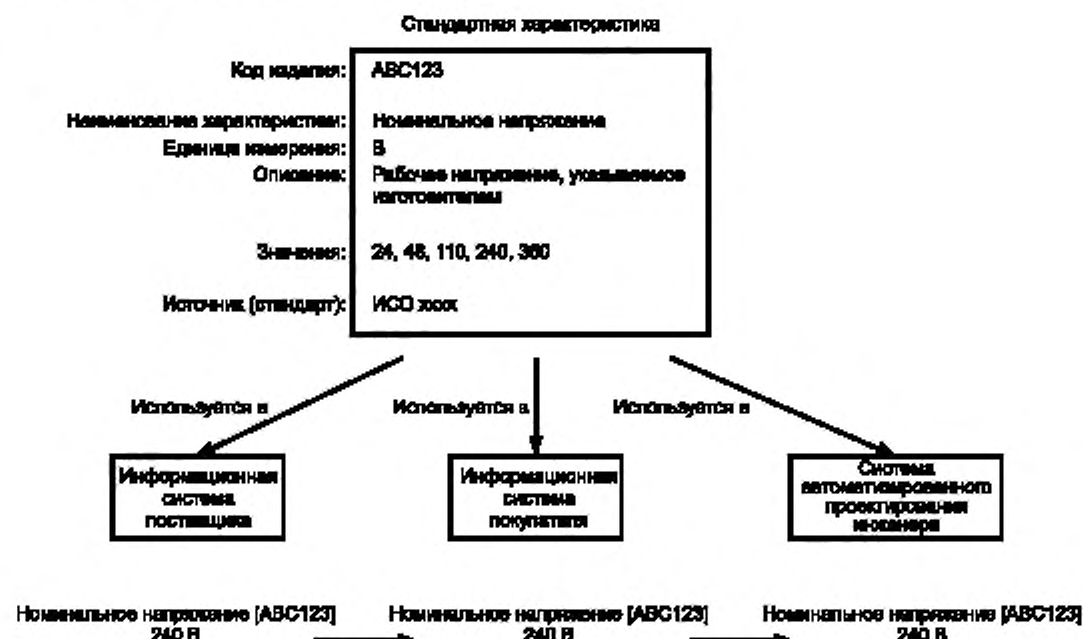
Рисунок 3 — Многократное использование характеристик продукции

каталогов продукции или библиотек информации о продукции в доступной для компьютера форме и в соответствии с общеизвестными и утвержденными методиками.