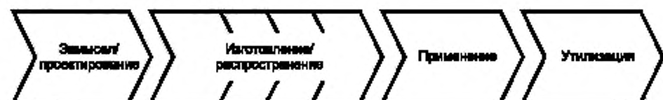
Рисунок 1 — Жизненный цикл продукции и передача информации

Этот процесс требует использования методологии, позволяющей представлять описание продукции в стандартизированной машинно-ориентированной форме, приемлемой для большинства промышленных систем. Подобная методология определена международными стандартами МЭК 61360-1 и ИСО 13584-42 и должна быть реализована как внутри компаний, так и при взаимодействии с бизнес-партнерами для того, чтобы она стала общепринятой практикой, повышающей эффективность и экономичность электронных коммерческих процессов.