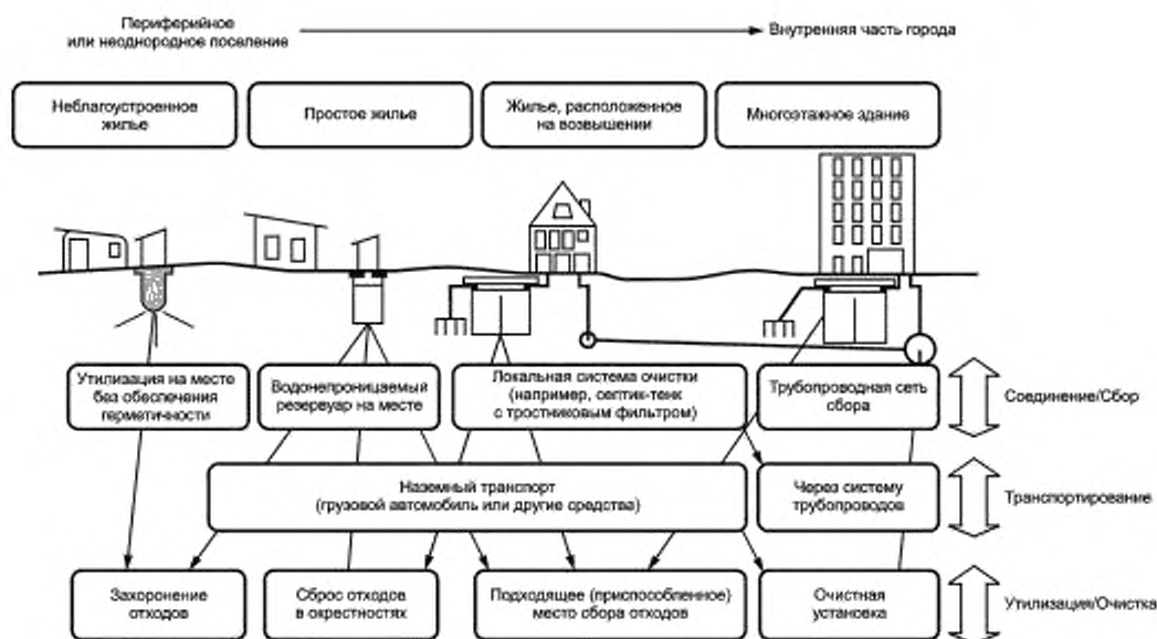
Рисунок В.2 — Типы систем удаления сточных вод