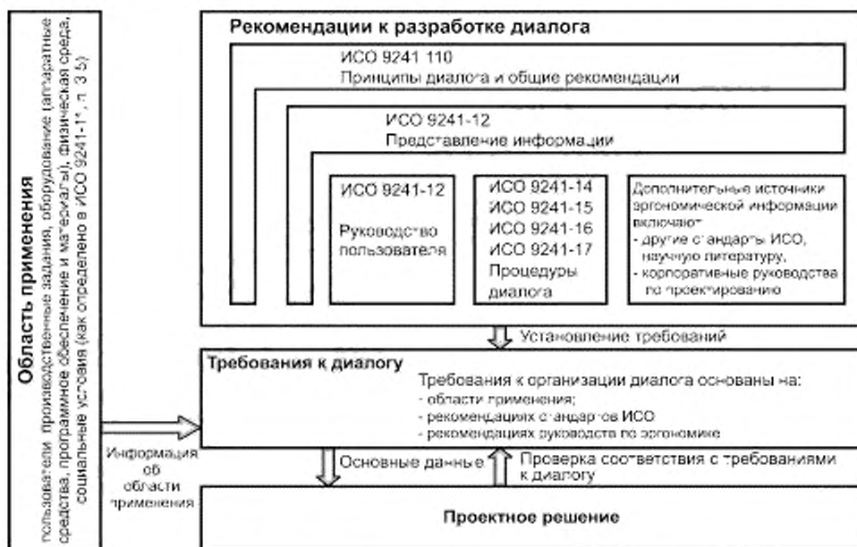
Рисунок 1 — Структурная схема применения настоящего стандарта

Настоящий стандарт является основой для установления требований к организации диалога, однако не определяет непосредственно эти требования. Требования к организации диалога зависят от области применения, для которой интерактивная система разработана и/или в которой ее используют, и требований, разработанных для этой области применения.