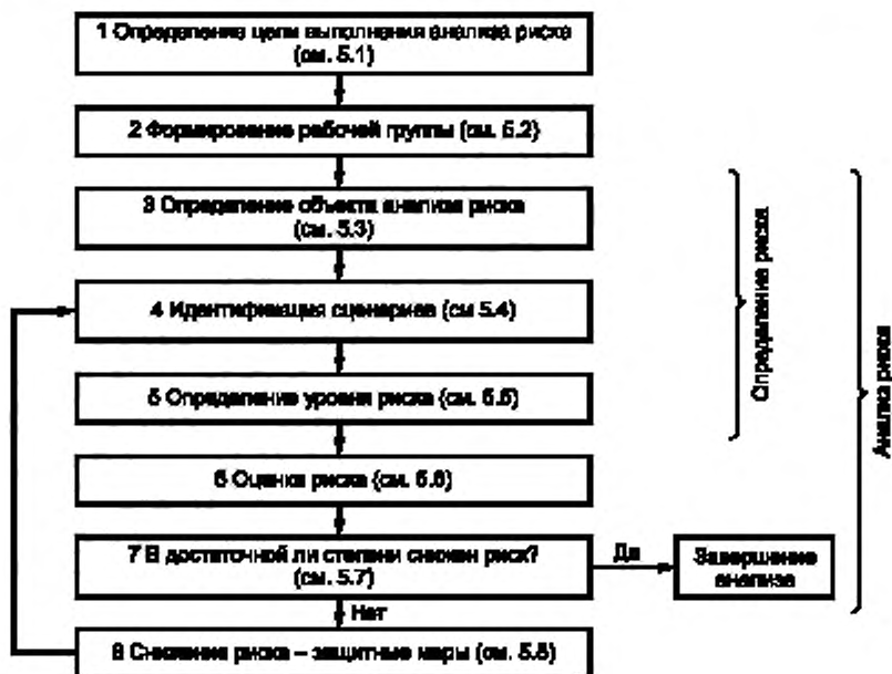
Рисунок 1 — Схема выполнения анализа и снижения риска