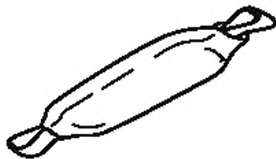
Рисунок 1 — Пример амортизатора как компонента