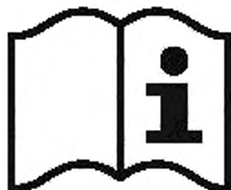
Рисунок 3 — Пиктограмма

а) пиктограмму для указания на то, что пользователь должен прочитать информацию, сообщаемую изготовителем (см. рисунок 3);