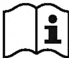
Рисунок 3 — Пиктограмма

а) пиктограмму на страховочной привязи для указания на то, что пользователи должны прочитать информацию, поставляемую изготовителем (см. рисунок 3);