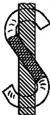
Рисунок 1 — S-крутка

Примечание — Могут быть использованы строчные буквы s и z, если это определяется особыми условиями.