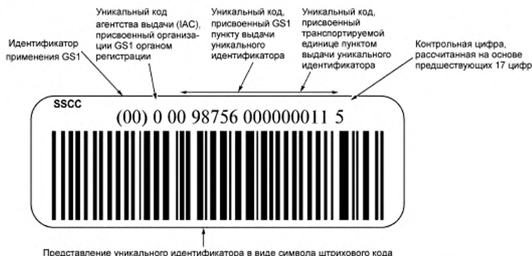
Рисунок В.1 — Представление уникального идентификатора транспортируемых единиц в символе штрихового кода GS1-128

В соответствии с правилами Всемирного почтового союза (УПУ) уникальный идентификатор должен содержать не более 35 алфавитно-цифровых знаков, где первый знак "J" является кодом агентства выдачи, присвоенным УПУ органом регистрации. Следующие знаки присваивает УПУ для учета и идентификации почтовых регионов. В соответствующих стандартах Всемирного почтового союза (УПУ) установлены несколько различных структур. Одна из них использует двухзначные коды стран в соответствии с ИСО 3166 для учета почтовых регионов национальных почтовых органов каждой страны. Этот «идентификатор почтового органа» сопровождается полем свободного формата, в котором каждый почтовый орган может устанавливать собственную структуру в рамках настоящего стандарта (рисунок В.2).