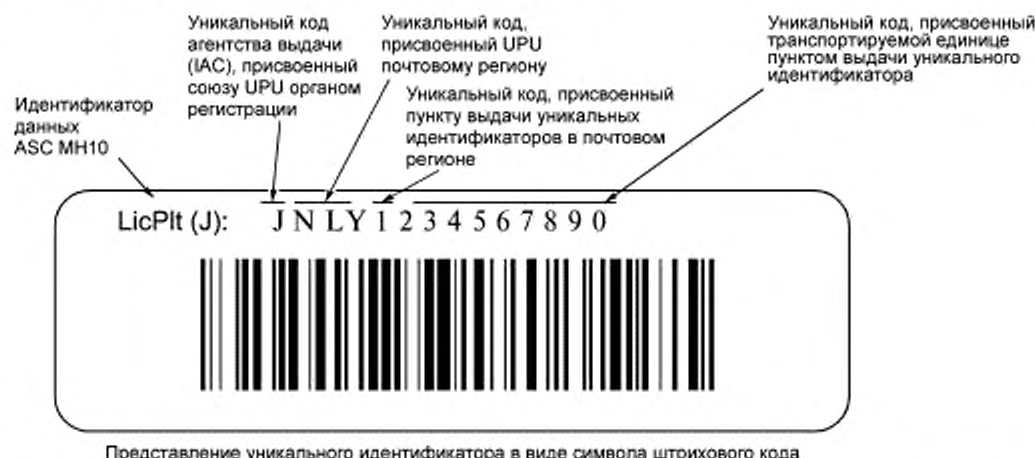
Рисунок В.2 — Представление уникального идентификатора транспортируемых единиц в символе штрихового кода Code 128

В соответствии с правилами Всемирного почтового союза (УПУ) уникальный идентификатор должен содержать не более 35 алфавитно-цифровых знаков, где первый знак "J" является кодом агентства выдачи, присвоенным УПУ органом регистрации. Следующие знаки присваивает УПУ для учета и идентификации почтовых регионов. В соответствующих стандартах Всемирного почтового союза (УПУ) установлены несколько различных структур. Одна из них использует двухзначные коды стран в соответствии с ИСО 3166 для учета почтовых регионов национальных почтовых органов каждой страны. Этот «идентификатор почтового органа» сопровождается полем свободного формата, в котором каждый почтовый орган может устанавливать собственную структуру в рамках настоящего стандарта (рисунок В.2).