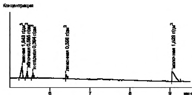
Рисунок А.2 — Электрофореграмма образца винопродукции

П р и м е ч а н и е — На электрофореграммах возможно появление пиков неидентифицированных кислот, не мешающих проведению количественного анализа.