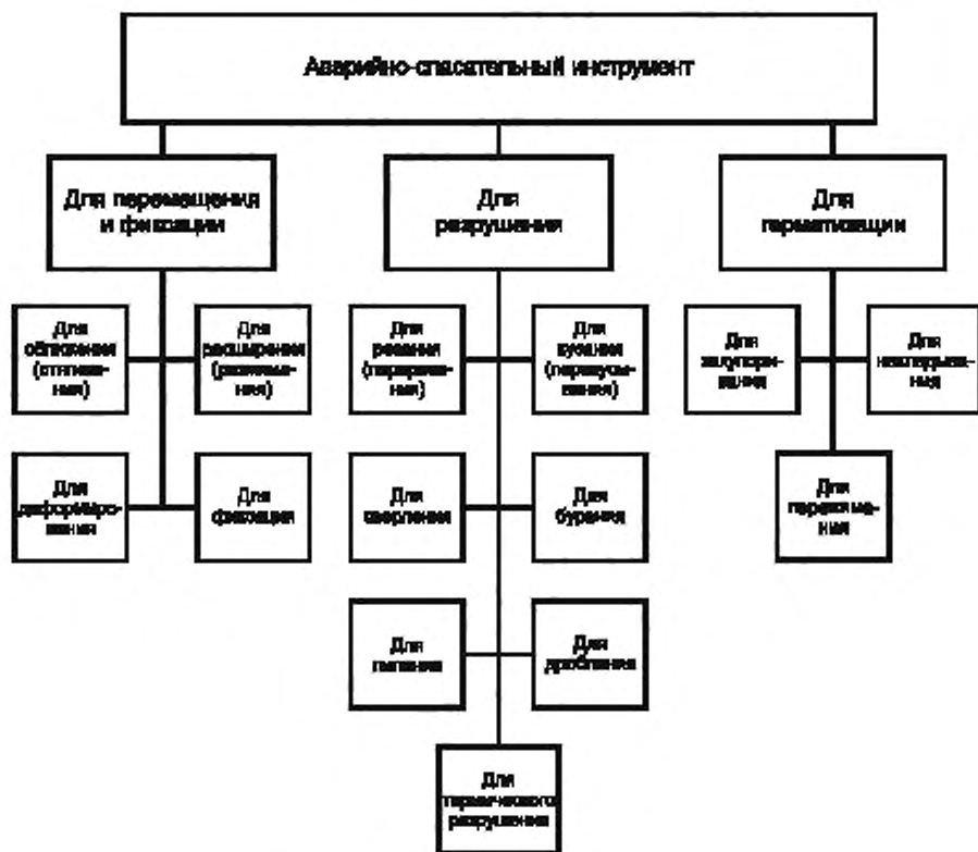
Рисунок А.1 — Схема классификации АПИ по признаку «Операция»