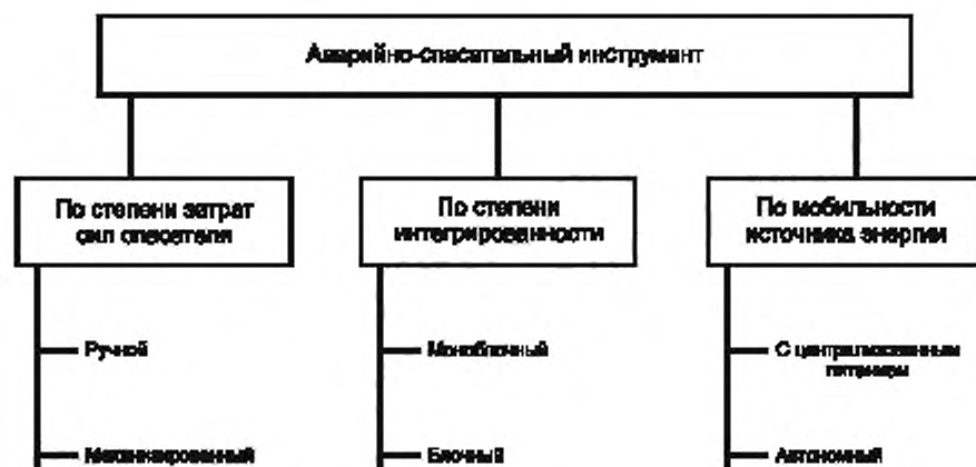
Рисунок А.3 — Схема классификации АПИ по признаку «Конструктивное исполнение инструмента»