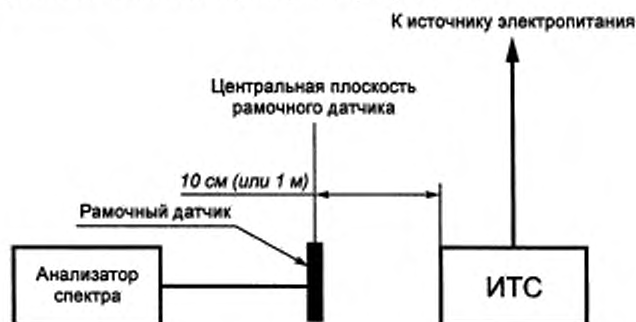
Рисунок А.2 — Испытательная установка для измерения магнитного поля, создаваемого ТС

Установка для проведения испытаний приведена на рисунке А.2.