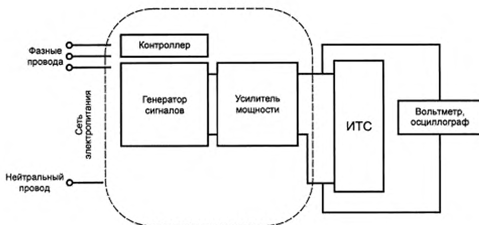
Рисунок 3 — Схема испытательного оборудования с усилителем мощности