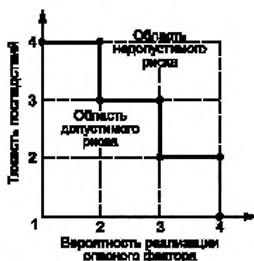
Рисунок Б.1 — Диаграмма анализа рисков

Если точка лежит на границе или выше границы, фактор учитывают, если ниже — не учитывают.