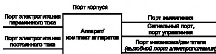
Рисунок 3 — Примеры портов аппарата/комплекта аппаратов

4.3 Если невозможно оценить уровни устойчивости к электромагнитным помехам при выполнении аппаратом/комплексом аппаратов каждой функции, следует выбирать наиболее критичный период работы, при котором обеспечивается наименьшая устойчивость к помехе конкретного вида.