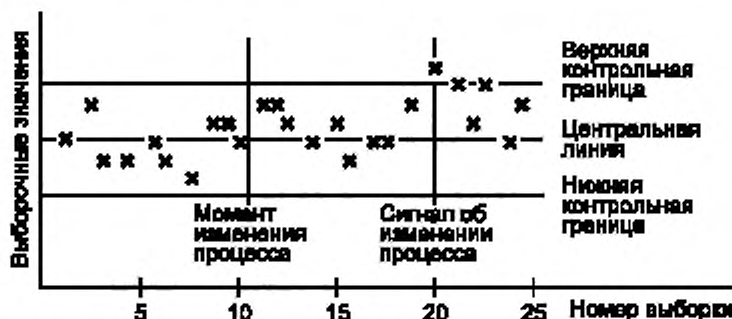
Рисунок 1 — Пример применения контрольной карты для случая, когда длина серии выборок равна 10 выборкам между моментом изменения процесса и сигналом об его изменении

значение промежутка времени, в течение которого КК не покажет, что процесс вышел из управляемого состояния. Причем, иногда фактическая длина серии выборок может быть больше или меньше ARL .