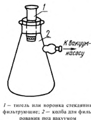
1 — тигель или воронка стеклянные фильтрующие; 2 — колба для фильтрования под вакуумом